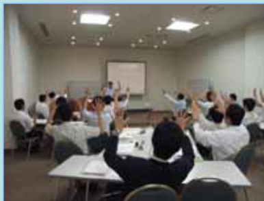
ボディランゲージ