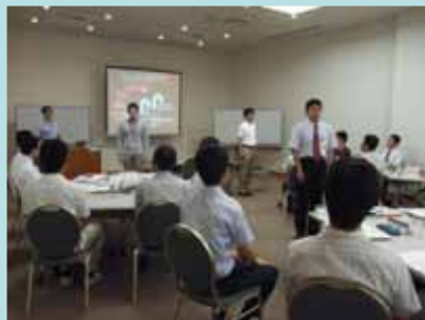
聴衆を巻き込む話し方