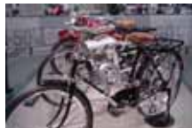
自転車用 補助エンジン